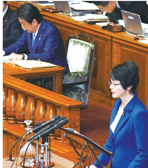
参院本会議で日米貿易協定と桜疑惑を追及＝11月20日