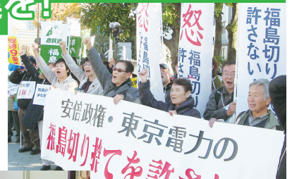
福島切り捨てを許さない！ 官邸前行動＝12月20日

北海道胆振東部地震から1年が過ぎました。厚真町、むかわ町、安平町、札幌市清田区を訪問し、住宅再建、被災者の暮らしを支える施策を求めました。