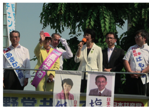
埼玉県北朝霞駅前にて=5月20日