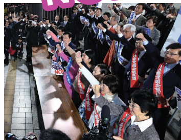
「共謀罪」法案を廃案に、参院議員面会所前=4月6日