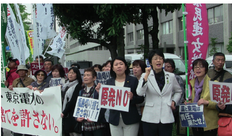
被災住民と福島を切り捨てるな官邸前行動=4月26日