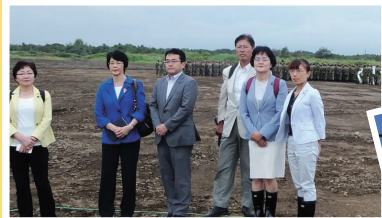
北海道大演習場で行われた日米共同訓練を視察=8月10日