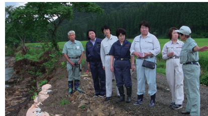
秋田県大仙市で豪雨被害調査=8月18日