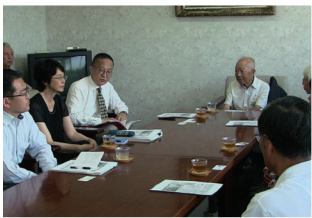
JR北海道の廃線問題で利用者と懇談=8月23日